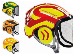
PROTOS Arboristhelm CHF 265.- Art. Nr. 205002