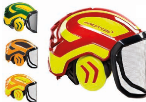
PROTOS Forsthelm CHF 224.- Art. Nr. 204002

Pfanner hat sich seit ihrer Gründung der Schaffung von erstklassiger Forstbekleidung und Schutzausrüstung verschrieben. Pfanner steht für jahrzehntelange Erfahrung, kombiniert mit neuesten Technologien und Materialien. Das Herzstück der Kollektion ist die enge Zusammenarbeit mit Forstprofis, die sicherstellen, dass jedes Produkt den tatsächlichen Anforderungen des Arbeitsalltags im Wald gerecht wird. Die Langlebigkeit, der Tragekomfort und die Sicherheit, die Pfanner bietet, sind in der Branche unübertroffen.