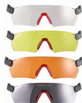
PROTOS Schutzbrille CHF 44.- Art. Nr. 204090